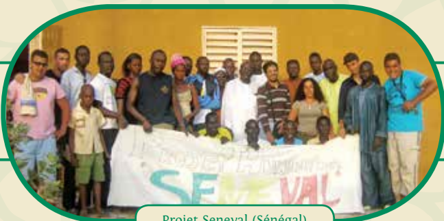
Projet Seneval (Sénégal)

enregistré auprès du FEJ (Fond Européen pour la Jeunesse).