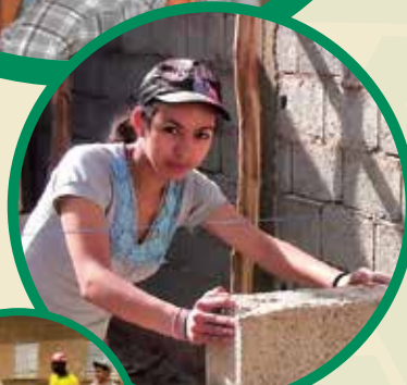
Projet Bravo (Maroc)