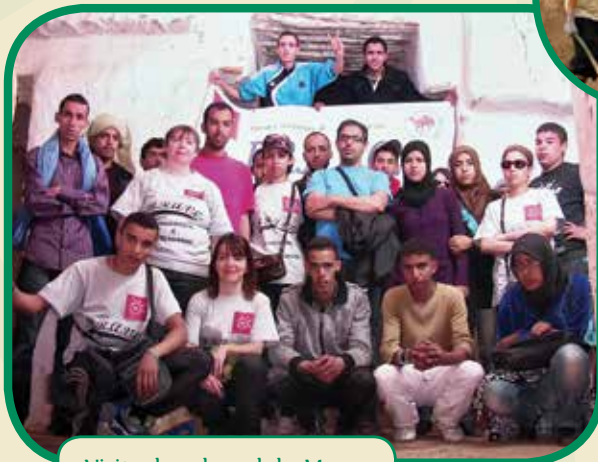
Visite dans le sud du Maroc