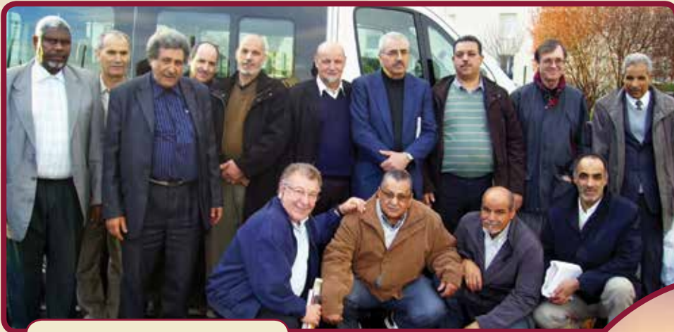
Sortie au musée de l'immigration